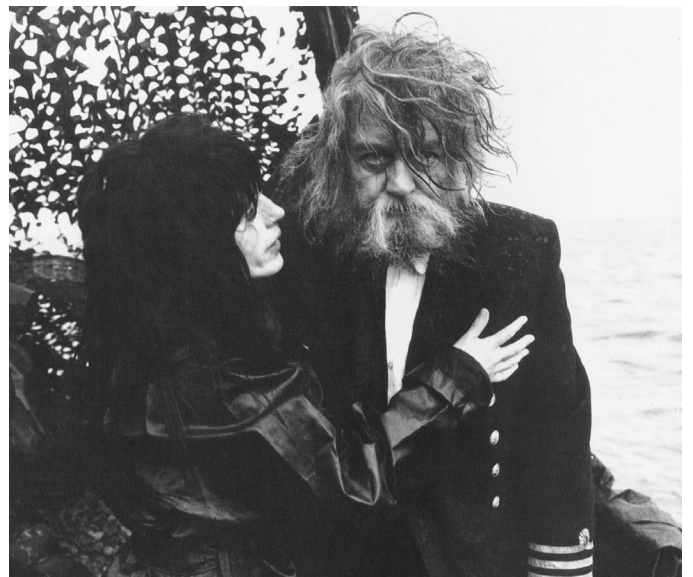
Insensibilité chagrine , 1987

Le travail du son et de la voix nous conduit naturellement à évoquer l'acteur professionnel, car il existe pour Sokourov bien sûr. Notre hypothèse de départ supposait que la question du professionnalisme n'était pas la principale pour lui, du moins pas un critère déterminant dans le choix de ses inter-