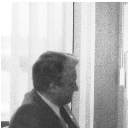
Boris Eltsine, Un exemple

Dans les documentaires, la mort n'est parfois signifiée que symboliquement (canons opposés à la foule dans Sacrifice du soir ; musique grinçante ou tonitruante au défilement des troupes nazies dans Sonate pour Hitler ; décomposition d'une